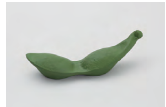
枝豆 サイズ： 幅 6× 奥行 1× 高さ 2cm