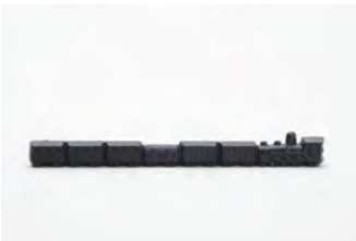
汽車 サイズ： 幅 18.5× 奥行 1.5× 高さ 2.5cm