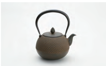
丸形アラレ 大 容量：1.5L サイズ：直径 14.5cm × 高さ 23cm