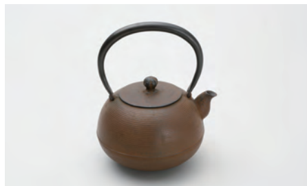
丸形糸目 容量：1.1L サイズ：直径 13.5cm × 高さ 20cm