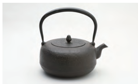
平丸肌 容量：1.9L サイズ：直径 17.5cm × 高さ 20cm