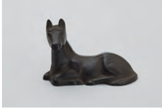
座馬 サイズ： 幅 9× 奥行 4× 高さ 6cm