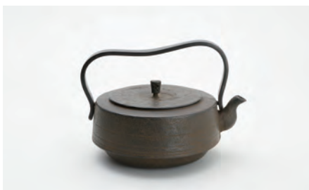
広口 容量：1.2L サイズ：直径 22cm × 高さ 15cm