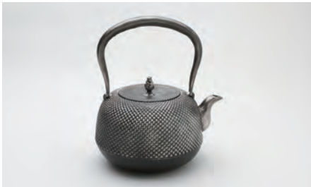
砂鉄 丸南部アラレ 小