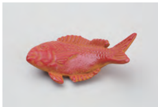
鯛 サイズ： 幅 6.5× 奥行 3.5× 高さ 2cm