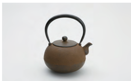
丸形梨地アラレ 容量：1.1L サイズ：直径 12cm × 高さ 20cm