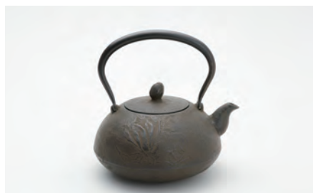
宝珠木蓮 容量：1.4L サイズ：直径 17cm × 高さ 19cm