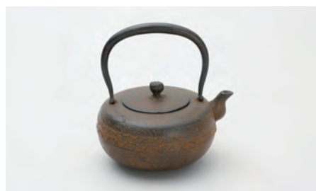
平丸形露芝 容量：1.1L サイズ：直径 15cm × 高さ 18cm