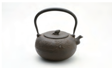
柚子松 容量：1.2L サイズ：直径 17cm × 高さ 18cm