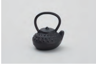
てつびん ミニ アラレ サイズ： 幅 3.5× 奥行 3× 高さ 4.5cm