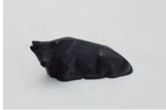
座牛 サイズ： 幅 7.5× 奥行 4× 高さ 3.5cm