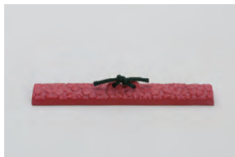
桜 中 サイズ： 幅 18.5× 奥行 2.5× 高さ 3.5cm