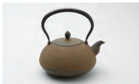
宝珠アラレ 小 容量：1.4L サイズ：直径 19.5cm × 高さ 19cm