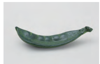
さやえんどう サイズ： 幅 7× 奥行 1.5× 高さ 1.5cm