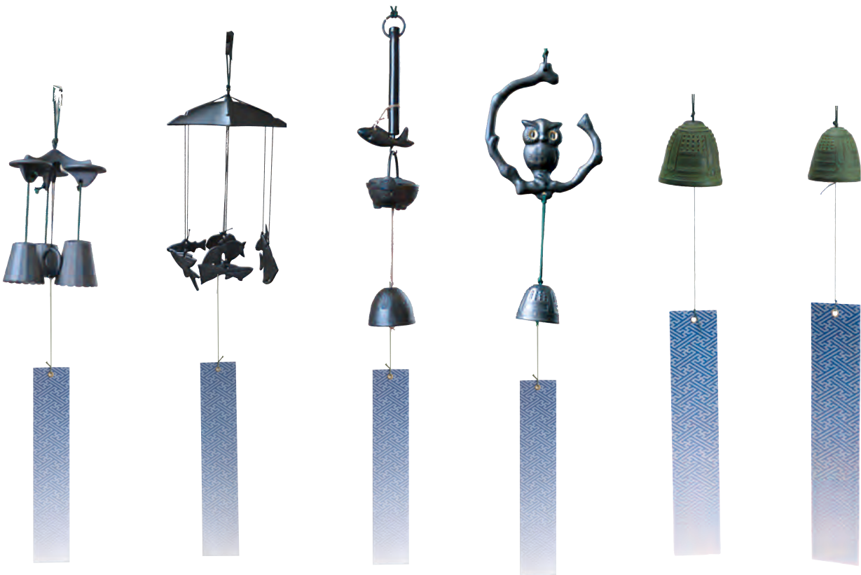
三重奏 サイズ： 直径 10cm 高さ 20cm