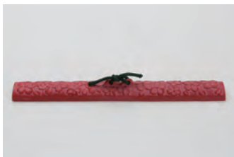
桜 大 サイズ： 幅 26.5× 奥行 3× 高さ 3.5cm