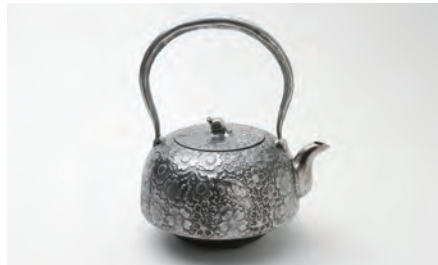
砂鉄 平南部桜 小