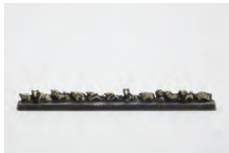
十二支 サイズ： 幅 22.5× 奥行 2× 高さ 2.5cm