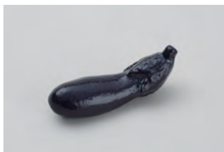
なす サイズ： 幅 5.5× 奥行 1.5× 高さ 2cm