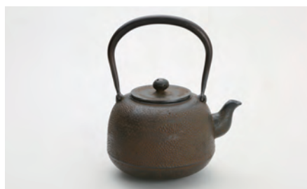
なつめぼかしアラレ 中 容量：1.1L サイズ：直径 13cm × 高さ 20cm