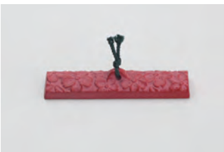
桜 小 サイズ： 幅 11× 奥行 2.5× 高さ 3cm