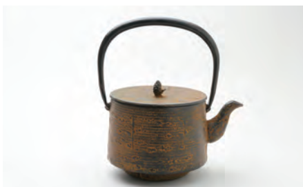
桜皮寸筒 中 容量：1.7L サイズ：直径 14.5cm × 高さ 23cm