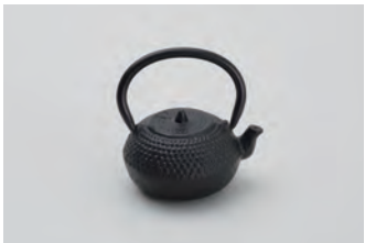
てつびん 大 アラレ サイズ： 幅 5.5× 奥行 4.5× 高さ 6.5cm