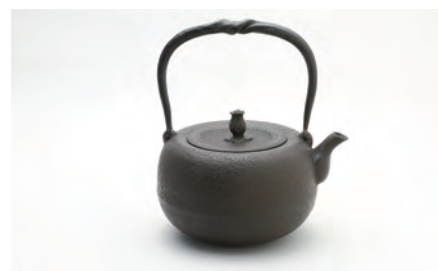
丸形姥口肌 容量：1.4L サイズ：直径 19cm × 高さ 22cm