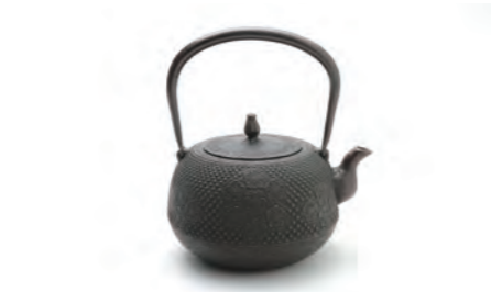
なつめ形桜 容量：1.5L サイズ：直径 15cm× 高さ 20cm