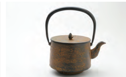
桜皮寸筒 中 容量：1.7L サイズ：直径 14.5cm×高さ 23cm