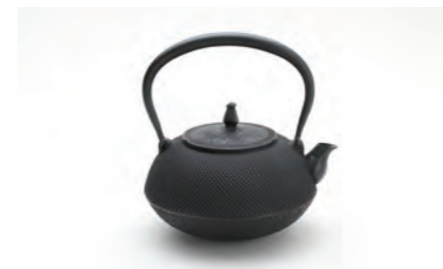
柚子アラレ 黒 容量：1.4L サイズ：直径 17.7cm× 高さ 20.7cm