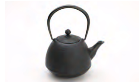
小丸 容量：0.7L サイズ：直径 12cm×高さ 20cm ツルを倒せます