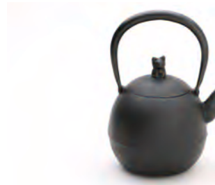
ねこ(丸) 容量：1.0L サイズ：直径 12cm×高さ 21.5cm