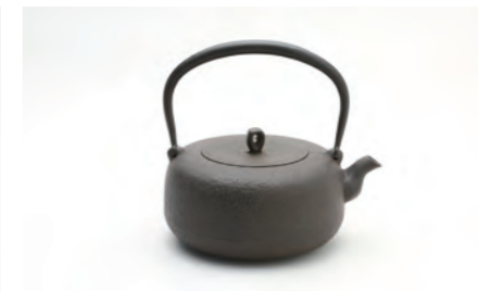
平丸小肌 容量：1.2L サイズ：直径 19cm×高さ 18.5cm