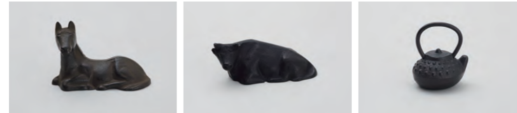
座馬 サイズ： 幅 9× 奥行 4× 高さ 6cm 座牛 サイズ： 幅 7.5× 奥行 4× 高さ 3.5cm てつびん ミニ アラレ サイズ： 幅 3.5× 奥行 3× 高さ 4.5cm