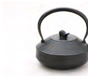
青海波 容量：1.5L サイズ：直径 17.5cm×高さ 19cm