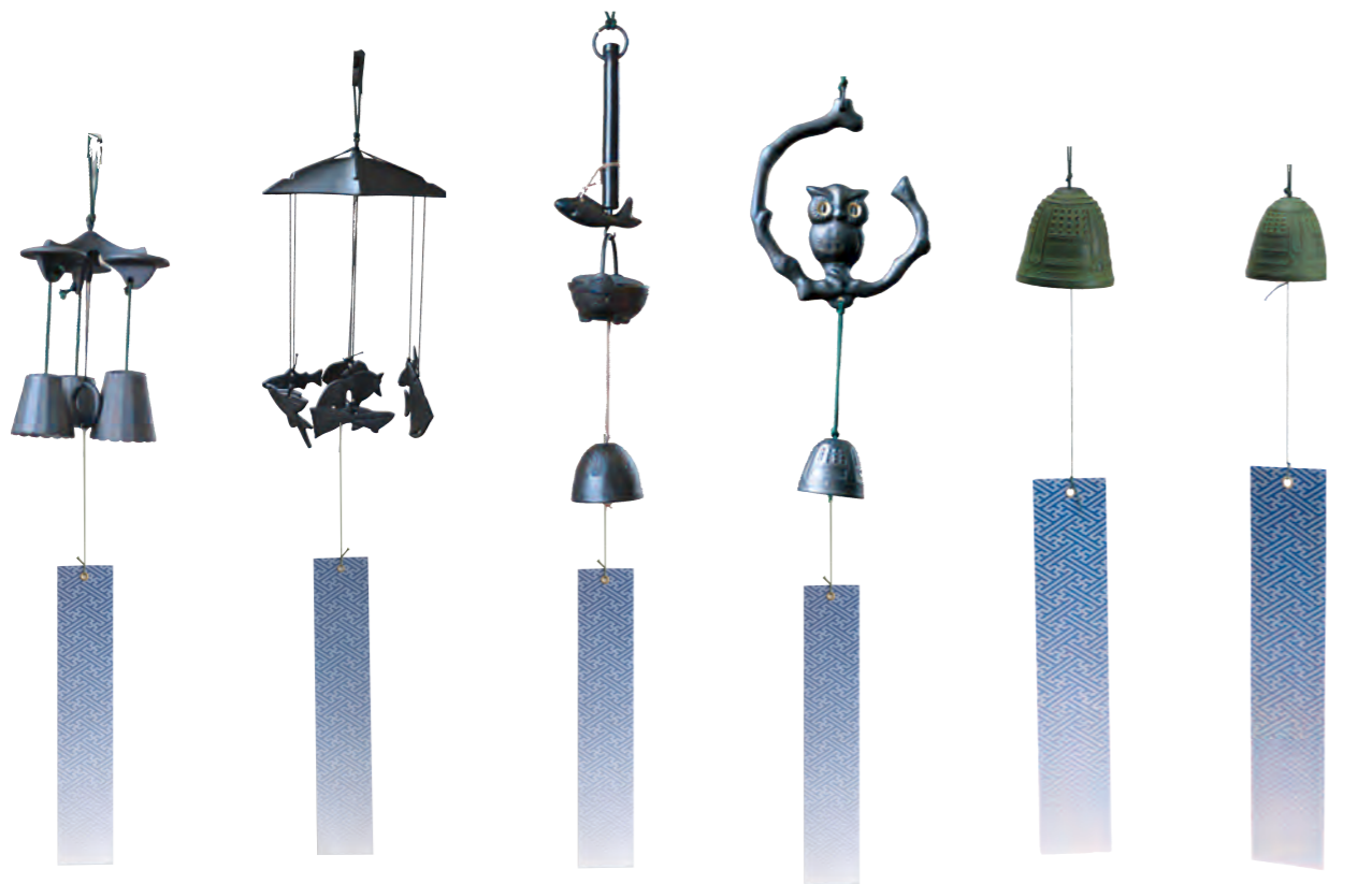
三重奏 サイズ： 直径 10cm 高さ 20cm 魚七匹 サイズ： 直径 16cm 高さ 30cm 自在カギ サイズ： 直径 6cm 高さ 30cm みみずく サイズ： 直径 11cm 高さ 23cm 梵鐘 サイズ： 直径 6cm 高さ 6cm つりがね 中 サイズ： 直径 4.7cm 高さ 5cm