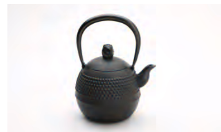
ハリネズミ 中 容量：1.0L サイズ：直径 12.5cm×高さ 21.5cm