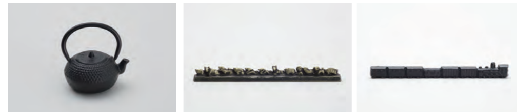
てつびん 大 アラレ サイズ： 幅 5.5× 奥行 4.5× 高さ 6.5cm 十二支 サイズ： 幅 22.5× 奥行 2× 高さ 2.5cm 自動車 サイズ： 幅 18.5× 奥行 1.5× 高さ 2.5cm