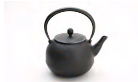
大丸肌 容量：1.6L サイズ：直径 14.5cm×高さ 22cm