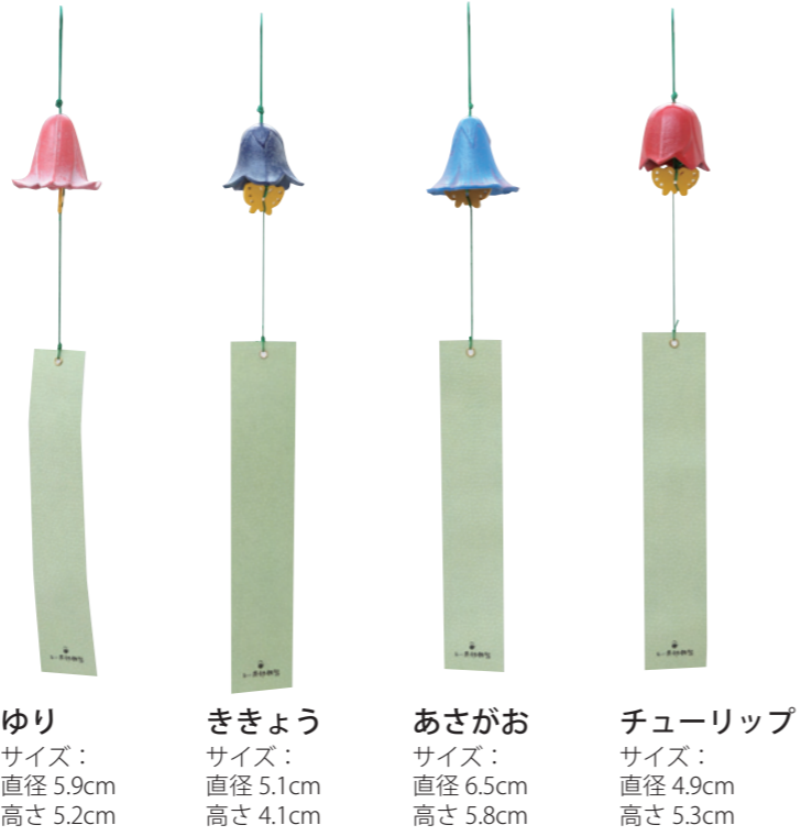
ゆり サイズ： 直径 5.9cm 高さ 5.2cm ききょう サイズ： 直径 5.1cm 高さ 4.1cm あさがお サイズ： 直径 6.5cm 高さ 5.8cm チューリップ サイズ： 直径 4.9cm 高さ 5.3cm