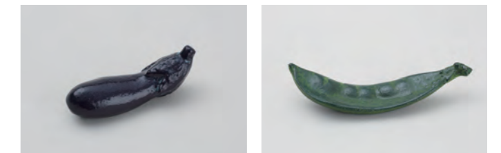
なす サイズ： 幅 5.5× 奥行 1.5× 高さ 2cm さやえんどう サイズ： 幅 7× 奥行 1.5× 高さ 1.5cm