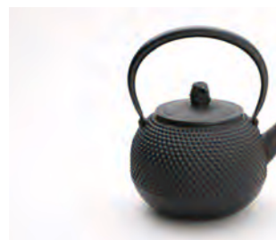
ハリネズミ 大 容量：1.6L サイズ：直径 15cm×高さ 22cm