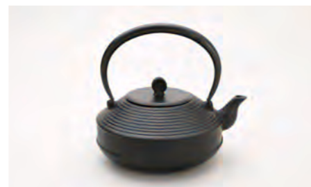
平形肌 容量：1.5L サイズ：直径 17.5cm×高さ 19cm