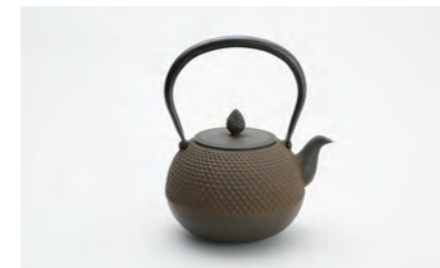
丸形アラレ 大 容量：1.5L サイズ：直径 14.5cm×高さ 23cm