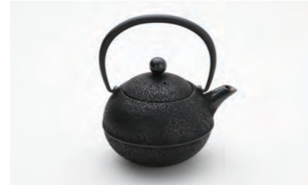
なごみ 容量：0.6L サイズ：直径 12.5cm× 高さ 16cm ツルを倒せませす