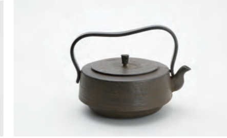
広口 容量：1.2L サイズ：直径 22cm×高さ 15cm