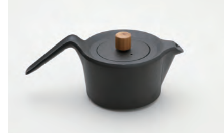
スワローポット 容量：0.6L サイズ：直径 13cm× 高さ 9.5cm IH対応