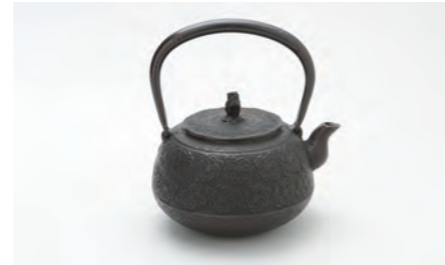
平丸桜 容量：1.3L サイズ：直径 17.5cm× 高さ 20cm