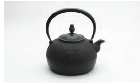
平丸アラレ 中 容量：1.4L サイズ：直径 20cm× 高さ 21cm