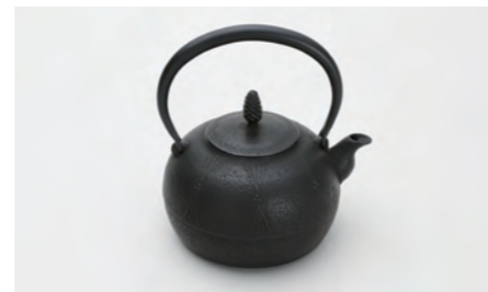
平丸松 容量：1.2L サイズ：直径 18cm× 高さ 19.5cm