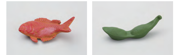
鯛 サイズ： 幅 6.5× 奥行 3.5× 高さ 2cm 枝豆 サイズ： 幅 6× 奥行 1× 高さ 2cm