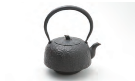
平南部桜 小 容量：1.4L サイズ：直径 19.5cm× 高さ 22.5cm