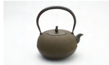
丸形アラレ 大 さび 容量：1.8L サイズ：直径 22.5cm×高さ 23cm