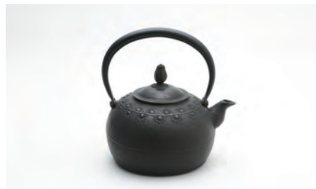
平丸花 容量：1.2L サイズ：直径 18cm× 高さ 19.5cm