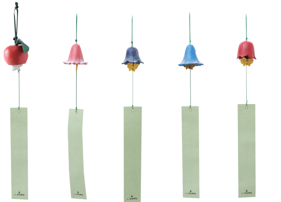
りんご サイズ： 直径 6.7cm 高さ 8cm ゆり サイズ： 直径 5.9cm 高さ 5.2cm ききょう サイズ： 直径 5.1cm 高さ 4.1cm あさがお サイズ： 直径 6.5cm 高さ 5.8cm チューリップ サイズ： 直径 4.9cm 高さ 5.3cm