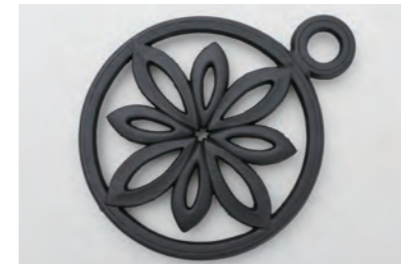
木の实 サイズ：幅 22cm× 奥行 17cm× 高さ 2cm