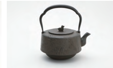
角万代松 容量：1.2L サイズ：直径 18cm×高さ 20cm