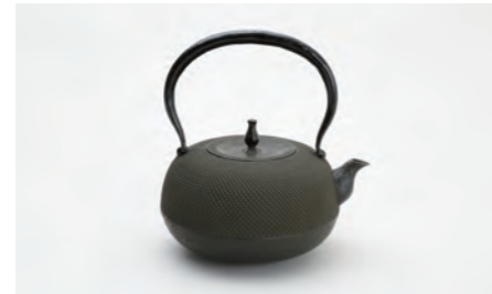
丸形アラレ 大 黒 容量：1.8L サイズ：直径 22.5cm×高さ 23cm