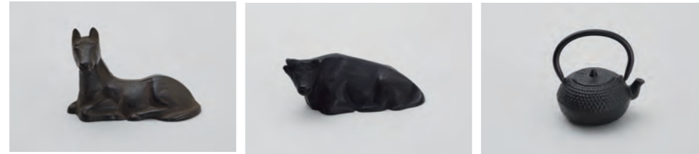
座馬 サイズ： 幅 9× 奥行 4× 高さ 6cm 座牛 サイズ： 幅 7.5× 奥行 4× 高さ 3.5cm てつびん アラレ (大) サイズ： 幅 5.5× 奥行 4.5× 高さ 6.5cm