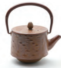
桜皮寸筒 容量：0.25L サイズ：直径 13cm× 高さ 14cm