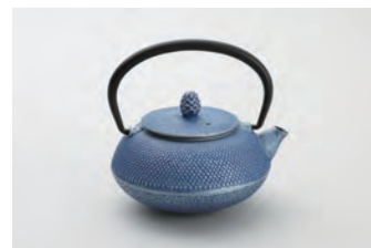
丸アラレ 藍 容量：0.3L サイズ：直径11cm× 高さ12cm