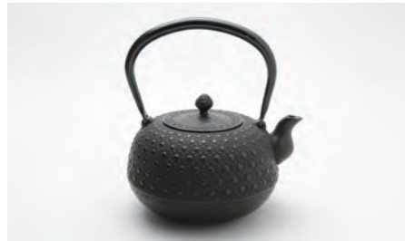
丸形九重アラレ 容量：1.5L サイズ：直径 16.5cm× 高さ 21.5cm