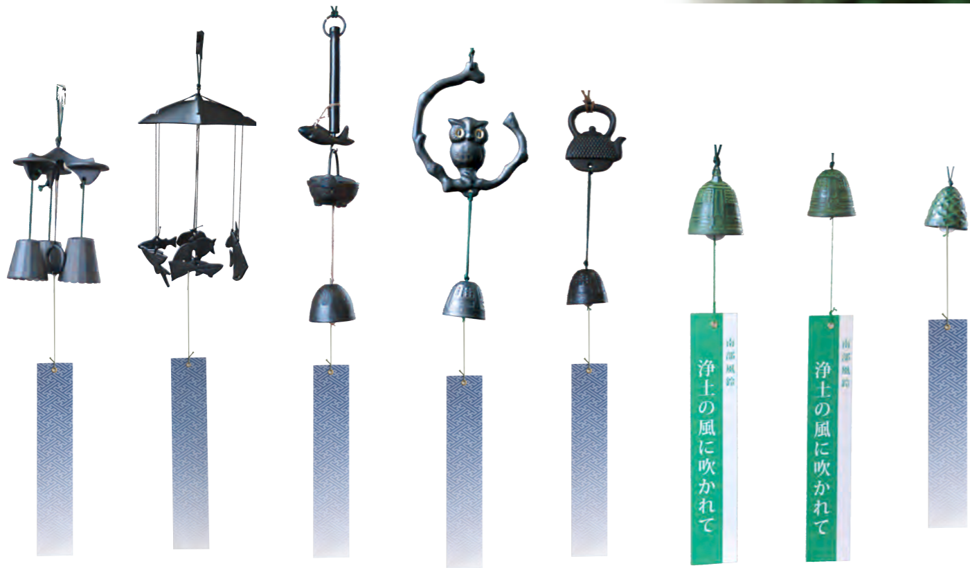
三重奏 サイズ： 直径 10cm 高さ 20cm 魚七匹 サイズ： 直径 16cm 高さ 30cm 自在カギ サイズ： 直径 6cm 高さ 30cm みみずく サイズ： 直径 11cm 高さ 23cm てつびん サイズ： 直径 6cm 高さ 20cm 梵鐘 サイズ： 直径 5.5cm 高さ 7cm つりがね (中) サイズ： 直径 5cm 高さ 5cm 松笠 サイズ： 直径 4.5cm 高さ 5cm