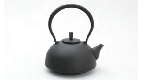
Nanbu (大) 容量：1.1L サイズ：直径 16cm× 高さ 20cm IH対応