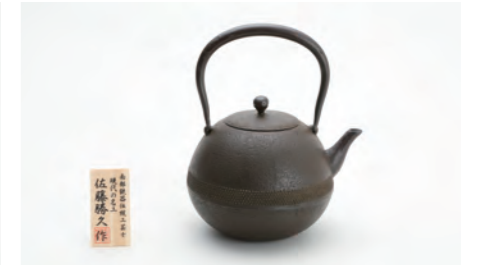
丸アラレ肌 容量：1.4L サイズ：直径 14.5cm× 高さ 21.5cm