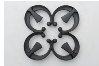
四つ葉 サイズ：幅 15cm× 奥行 15cm× 高さ 2cm