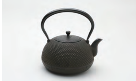
いがぐりアラレ 容量：1.0L サイズ：直径 18.5cm× 高さ 17cm