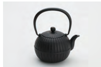
柚子菊 黒 容量：0.4L サイズ：直径14cm× 高さ17cm