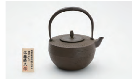
肩平アラレ 容量：1.0L サイズ：直径 16.5cm× 高さ 20.5cm