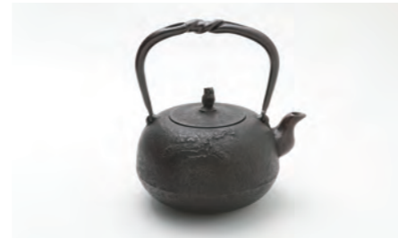
丸南部松 中 容量：1.6L サイズ：直径 20.5cm× 高さ 21.5cm