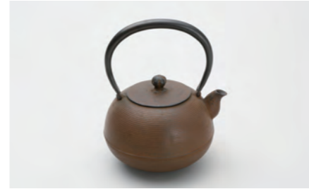
丸形糸目 容量：1.1L サイズ：直径 13.5cm×高さ 20cm