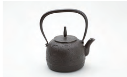
なつめ輪 容量：1.0L サイズ：直径 20cm× 高さ 20cm