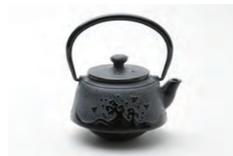
万代波千鳥 容量：0.34L サイズ：直径10.5cm× 高さ 13.5cm