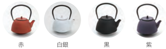
赤 白銀 黒 紫