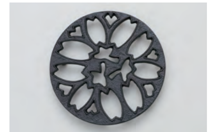
リーフ サイズ：直径16cm× 高さ 2cm