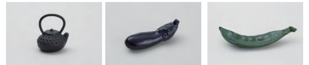
てつびん アラレ サイズ： 幅 3.5× 奥行 3× 高さ 4.5cm なす サイズ： 幅 5.5× 奥行 1.5× 高さ 2cm さやえんどう サイズ： 幅 7× 奥行 1.5× 高さ 1.5cm