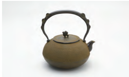
宝珠アラレ さび 容量：1.4L サイズ：直径 19cm×高さ 20cm