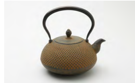
宝珠アラレ 小 容量：1.4L サイズ：直径 19.5cm×高さ 19cm