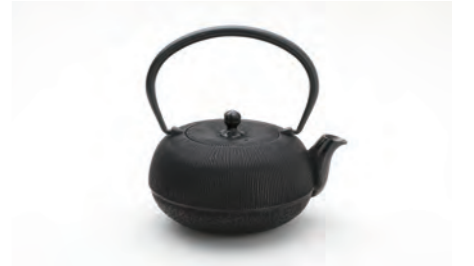
千筋 容量：0.7L サイズ：直径 13.5cm× 高さ 15cm ツルを倒せませす