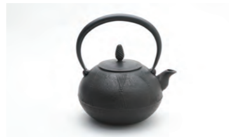
丸形松 容量：1.4L サイズ：直径 18cm× 高さ 19.5cm