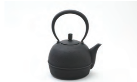
Sayu (大) 容量：1.0L サイズ：直径 16cm× 高さ 20cm IH対応