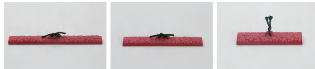
桜 大 サイズ： 幅 26.5× 奥行 3× 高さ 3.5cm 桜 中 サイズ： 幅 18.5× 奥行 2.5× 高さ 3.5cm 桜 小 サイズ： 幅 11× 奥行 2.5× 高さ 3cm