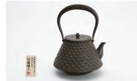
不二大アラレ 容量：2.0L サイズ：直径 16.5cm× 高さ 26.5cm