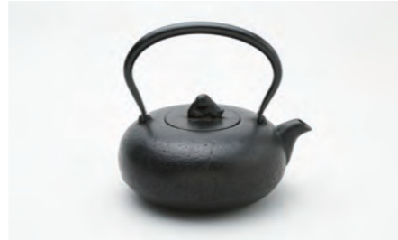
浮雲 小 容量：1.0L サイズ：直径 19cm× 高さ 17cm