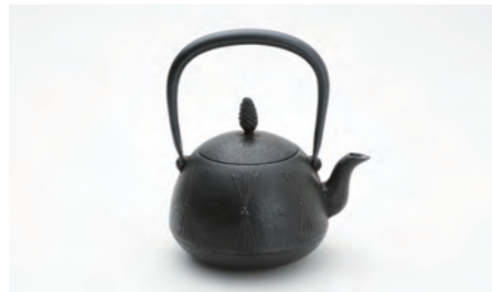
茄子形松 容量：1.0L サイズ：直径 14.5cm× 高さ 20cm