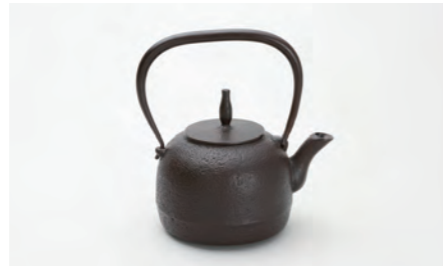
なつめ肌 容量：1.0L サイズ：直径 20cm× 高さ 20cm