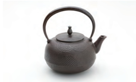
丸アラレ 小 容量：1.5L サイズ：直径 25cm× 高さ 21cm