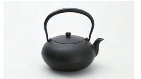
和 (大) 容量：0.8L サイズ：直径 16cm× 高さ 18cm ツルを倒せませす