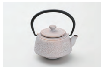
七宝 容量：0.4L サイズ：直径 10.5cm× 高さ 13.5cm