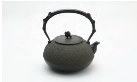
宝珠アラレ 黒 容量：1.4L サイズ：直径 19cm×高さ 20cm