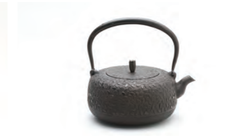
平丸小桜 容量：1.2L サイズ：直径 19cm×高さ 18.5cm