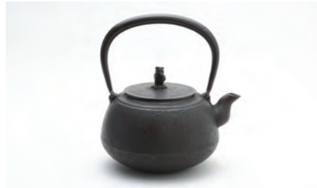
平丸肌 容量：1.3L サイズ：直径 17.5cm× 高さ 20cm