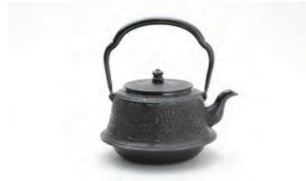
富士形桜 容量：1.8L サイズ：直径 20.5cm× 高さ 21.5cm