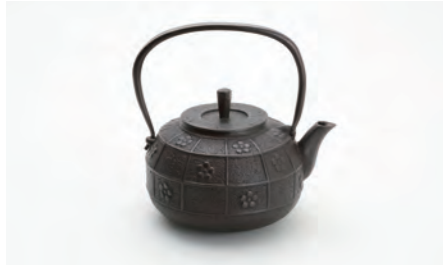
面取梅 容量：1.6L サイズ：直径 23cm× 高さ 21.5cm