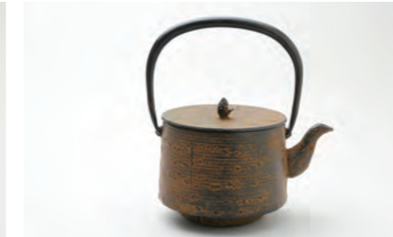
桜皮寸筒 中 容量：1.7L サイズ：直径 23cm×高さ 24cm