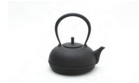
Sayu (小) 容量：0.5L サイズ：直径 15cm× 高さ 14.5cm IH対応