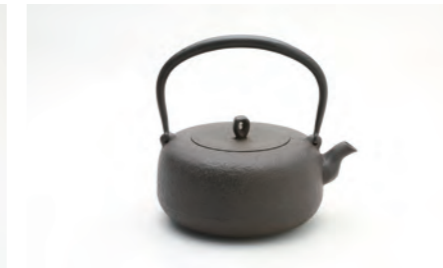
平丸小肌 容量：1.2L サイズ：直径 19cm×高さ 18.5cm