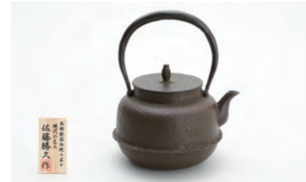
虫喰古代肌 容量：1.4L サイズ：直径 19cm× 高さ 23cm