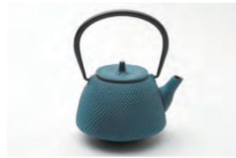
南部形アラレ 水色 容量：0.4L サイズ：直径 15cm× 高さ19cm