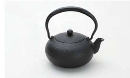
和 (小) 容量：0.5L サイズ：直径 13.5cm× 高さ 16cm ツルを倒せませす