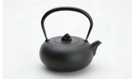
浮雲 大 容量：1.5L サイズ：直径 21cm× 高さ 20cm