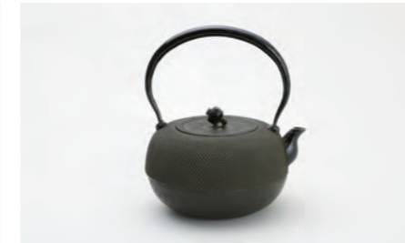
丸形アラレ 小 黒 容量：1.1L サイズ：直径 15cm×高さ 21.5cm