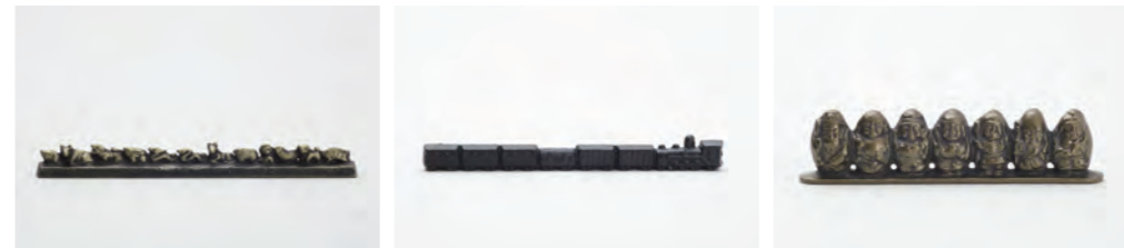
十二支 サイズ： 幅 22.5× 奥行 2× 高さ 2.5cm 汽車 サイズ： 幅 18.5× 奥行 1.5× 高さ 2.5cm 七福神 サイズ： 幅 15× 奥行 2.5× 高さ 4cm