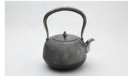
砂鉄 丸南部アラレ 小 容量：1.4L サイズ：直径 19.5cm× 高さ 23cm