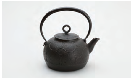
丸輪 容量：1.3L サイズ：直径 22cm× 高さ 20cm