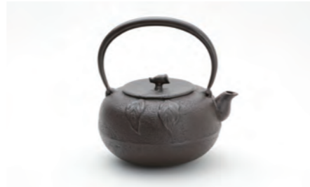
みかん 容量：1.6L サイズ：直径 21cm× 高さ 21cm