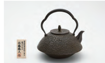
東屋桜 容量：1.5L サイズ：直径 20cm× 高さ 20.5cm