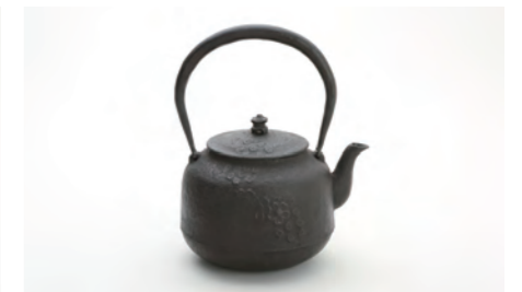
なつめ桜 容量：1.0L サイズ：直径 13.5cm× 高さ 21.5cm