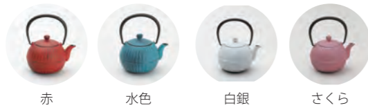
赤 水色 白銀 さくら