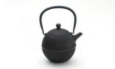
手まり 容量：0.8L サイズ：直径 17.8cm× 高さ 13.5cm ツルを倒せませす