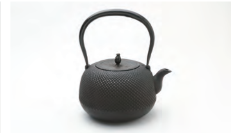
丸南部アラレ 小 [表紙掲載] 容量：1.4L サイズ：直径 19.5cm× 高さ 23cm