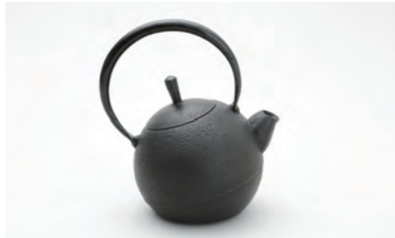
玉形肌 容量：1.0L サイズ：直径 14.5cm× 高さ 22cm